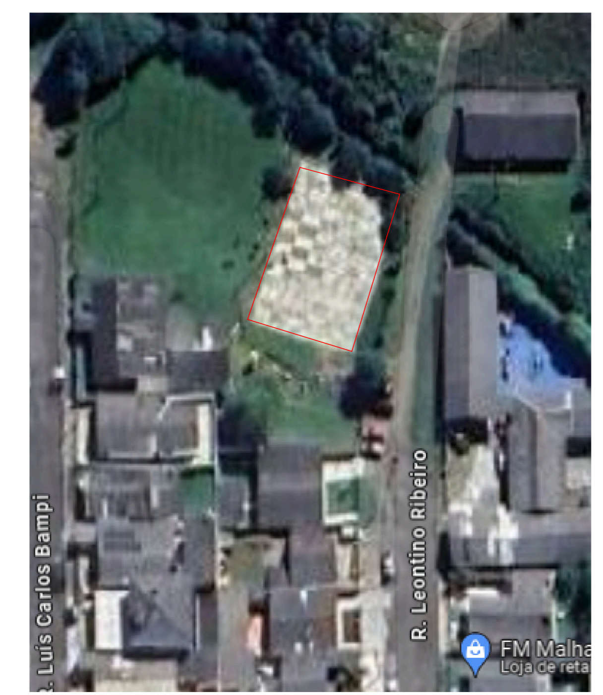
3 Localização sem escala Atualizada em 2024