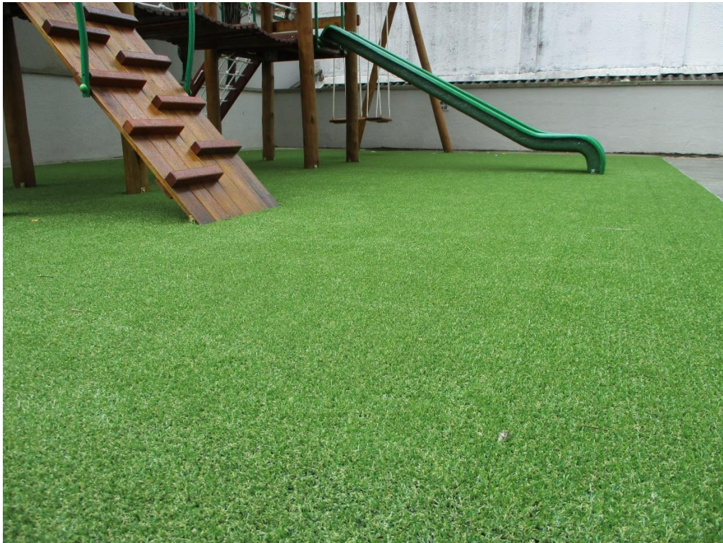
Figura ilustrativa – Grama Sintética em Parquinho