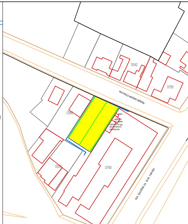
PLANTA DE LOCALIZAÇÃO ESC: 1/1000