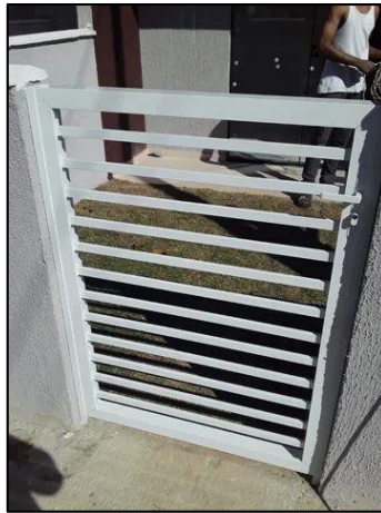
Imagem 13 – Exemplo de portão metálico de abrir para pedestre.