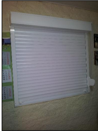
Imagem 07– Exemplo de janela de enrolar para cantina em alumínio branco.