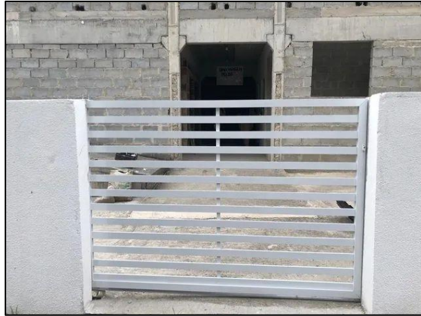
Imagem 12 – Exemplo de portão metálico de correr para pedestre.