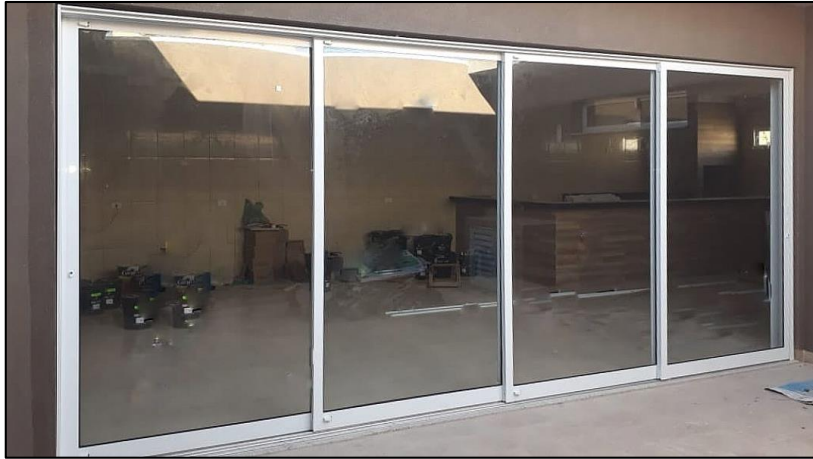
Imagem 02 – Exemplo de porta de correr com 4 folhas em alumínio branco.