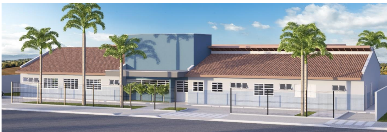
Imagem 3D 01 – Fachada Frontal