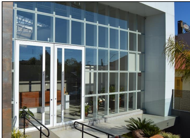
Imagem 06 – Exemplo de porta de abrir de vidro em fachada de pele de vidro.