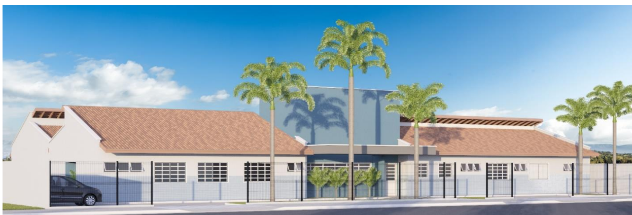
Imagem 3D 02 – Fachada Frontal