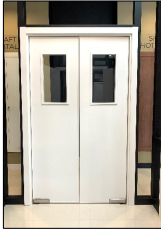
Imagem 05 – Exemplo de porta de vai e vem com duas folhas.