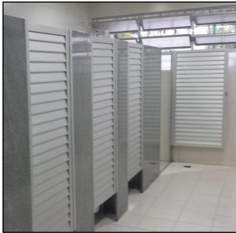
Imagem 03 – Exemplo de porta de abrir para cabines em alumínio branco.