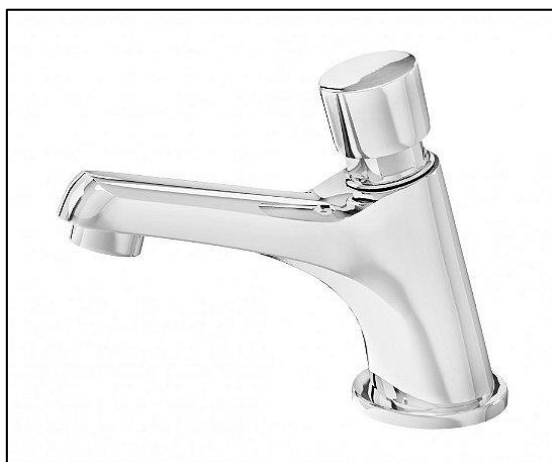
Imagem 14 – Exemplo com acionamento automático.

As torneiras para banheiros e lavatório deverá ser de acionamento automático.