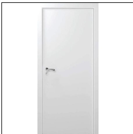
Imagem 01 – Exemplo de porta de abrir em madeira.

Todas as dimensões estão constantes em projeto.