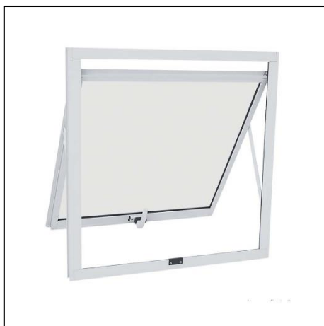
Imagem 10 – Exemplo de janela maximar alumínio branco.