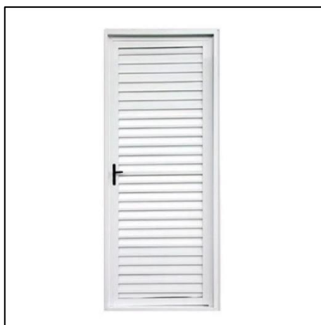
Imagem 04 – Exemplo de porta de abrir em alumínio branco.