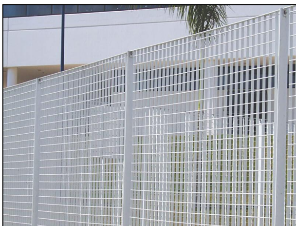
Imagem 11 – Exemplo de cerca metálica.

Os muros serão executados em alvenaria de tijolos cerâmicos com dimensões de 14,00 x 19,0 x 39,0 cm, assentados com argamassa de cimento, cal liquido e areia.