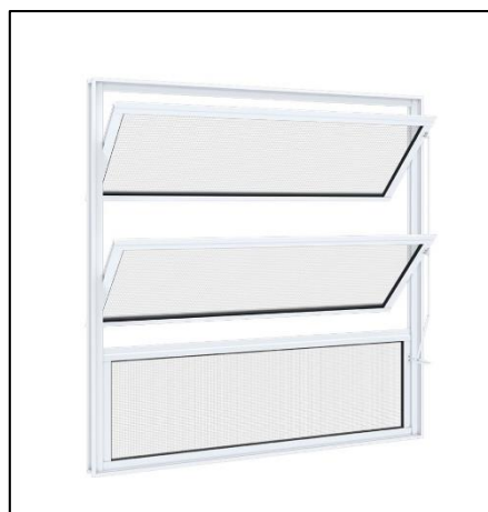
Imagem 09 – Exemplo de janela basculante alumínio branco.