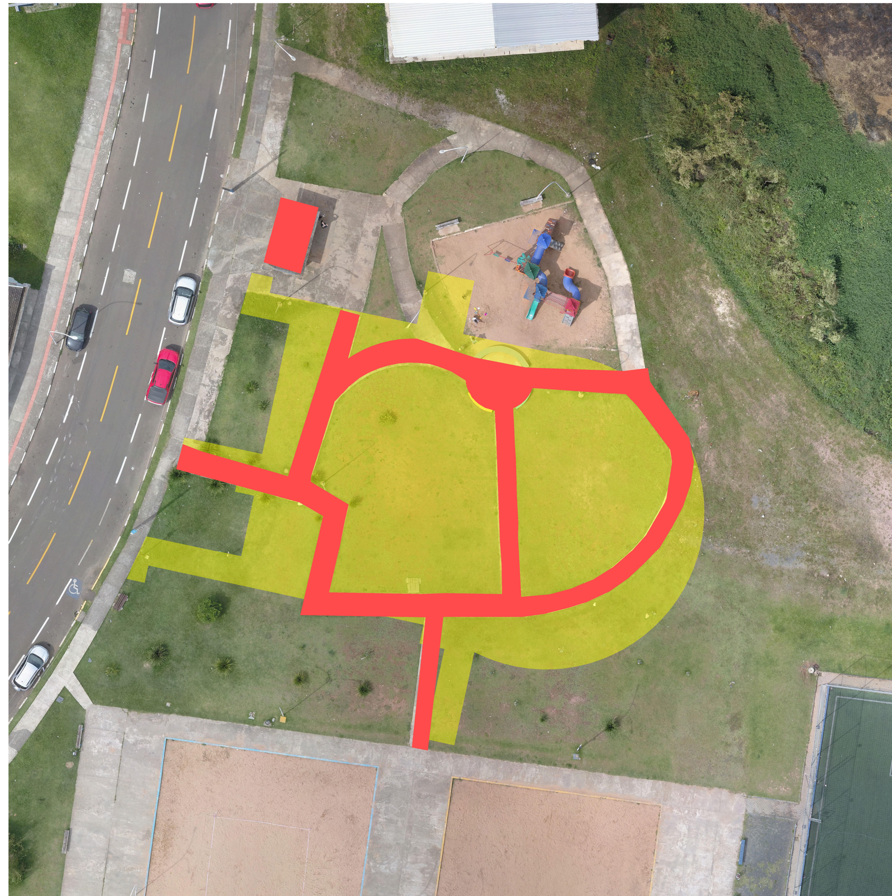
Planta de construção/demolição 1: 225