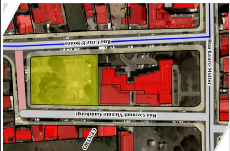
03 Localização sem escala