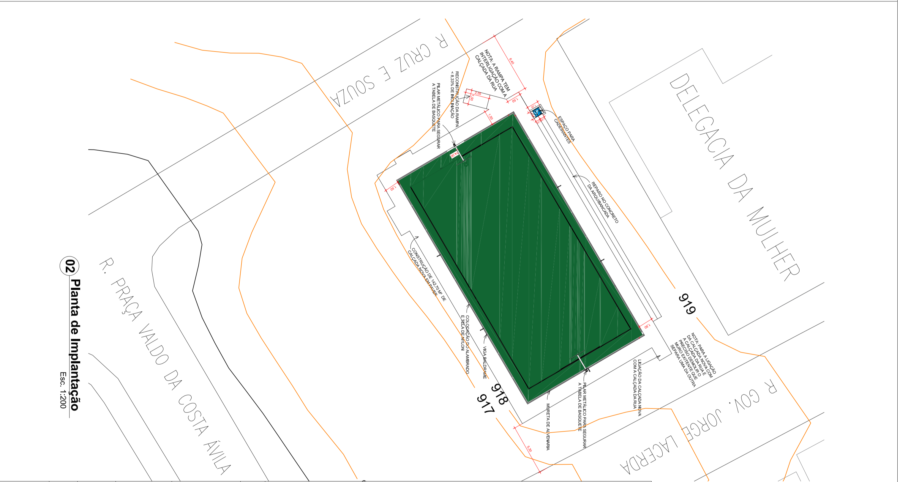
02 Planta de Implantação Esc. 1:200