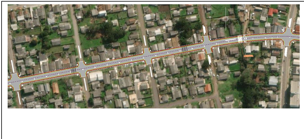
Figura 01 – Localização da área de intervenção