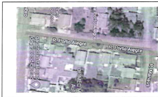
Figura 01 – Localização da área de intervenção