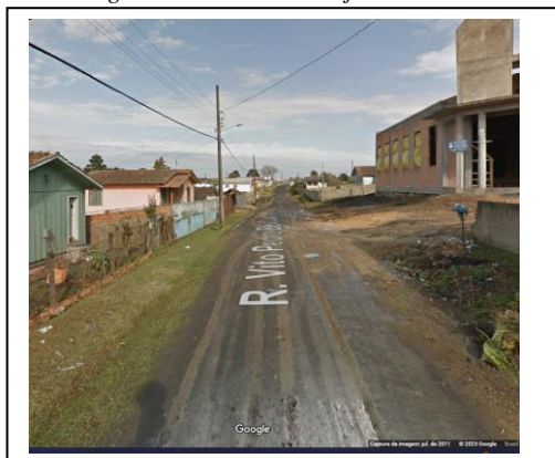
Figura 3 - Foto Rua Projetada - Meio