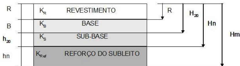
Tabela 6 – Caracterização pavimento