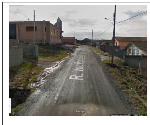
Figura 2- Foto Rua Projetada - Meio