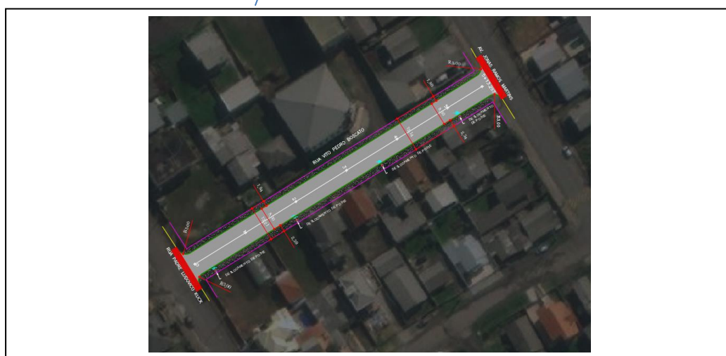
Figura 1- Localização da área de intervenção (trecho grifado)