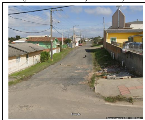
Figura 4 - Foto Rua Projetada – Est. final