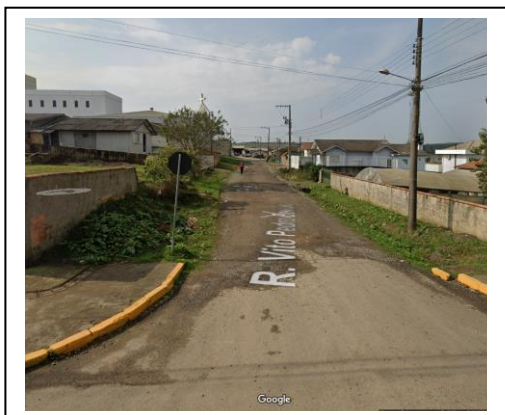
Figura 1- Foto Rua Projetada - Estaca inicial.