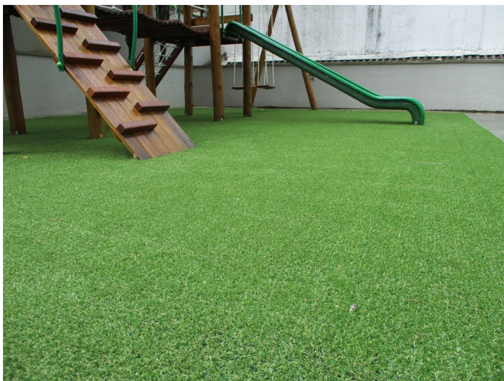
Figura ilustrativa – Grama Sintética em Parquinho