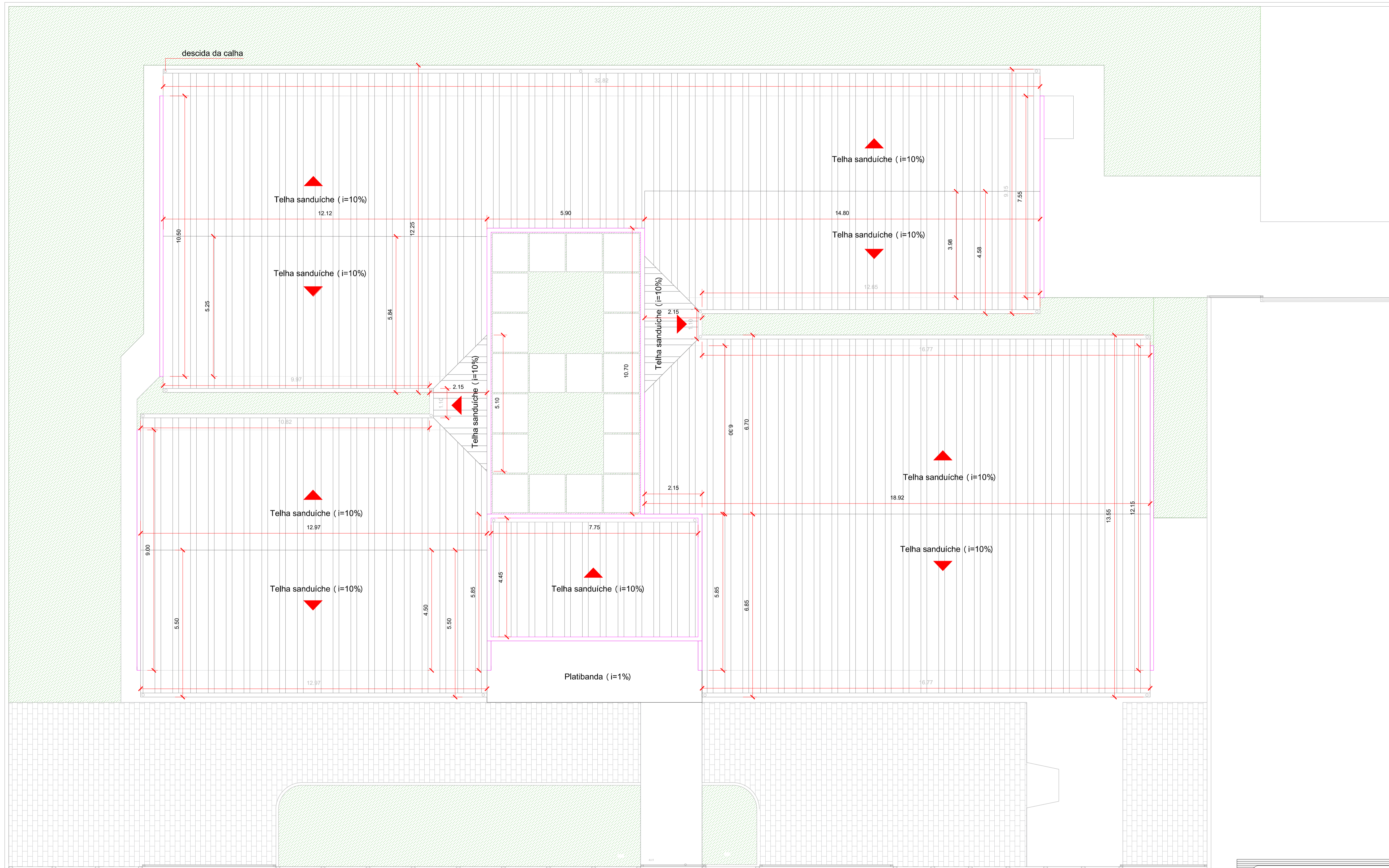
PLANTA DE COBERTURA ESCALA: 1/100