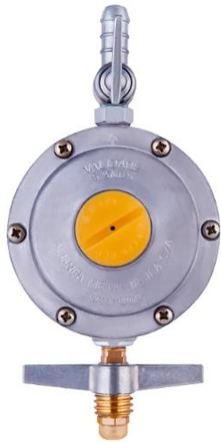
Regulador de pressão