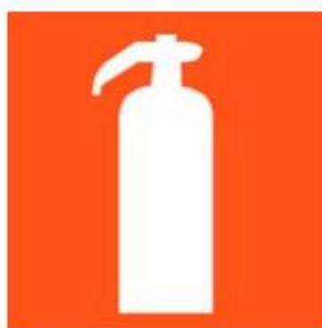
Figura 1 - pictograma indicativo de extintor de incêndio

Art. 18. Para a sinalização de parede, deve ser instalada placa com o pictograma da figura 1, conforme NBR 16820 imediatamente acima do extintor, com altura mínima de 1,80 m da base do pictograma ao piso acabado.