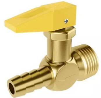
Registro tipo fecho rápido