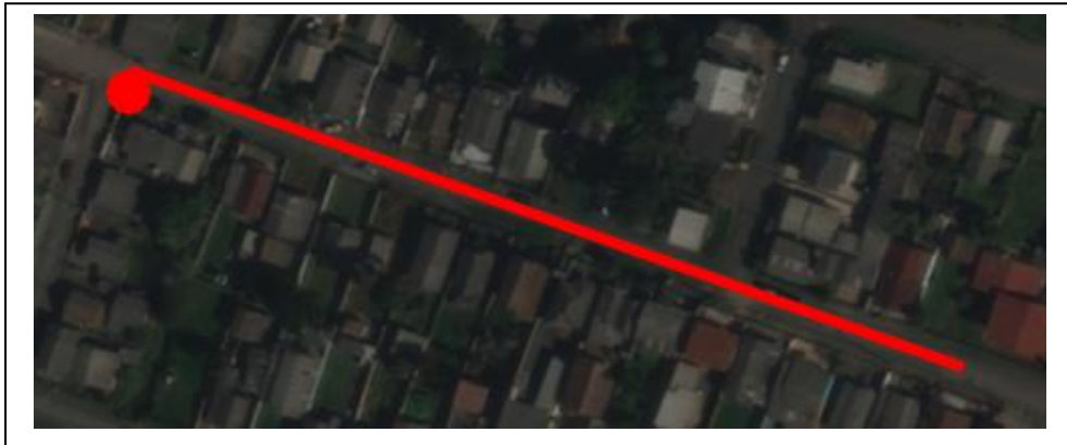
Figura 01 – Localização da área de intervenção