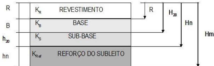
Tabela 6 – Caracterização pavimento

Fonte : Manual de Pavimentação DNIT, 2006.