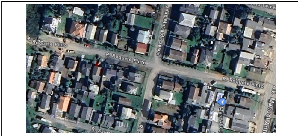
Figura 01 – Localização da área de intervenção