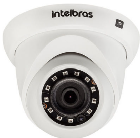
VIP 3230 D – FORA LINHA