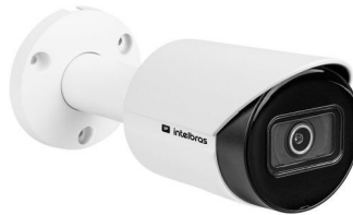
VIP 3230 B SL STARLIGHT