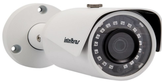
VIP 3230 B – FORA LINHA