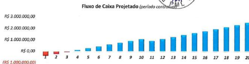
Quadro 20 - Indicadores do Fluxo de Caixa – Licitante FUNERÁRIA CRISTO REI LTDA.