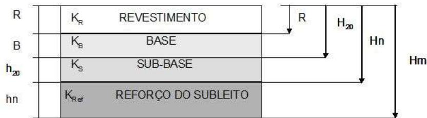
Tabela 6 – Caracterização pavimento