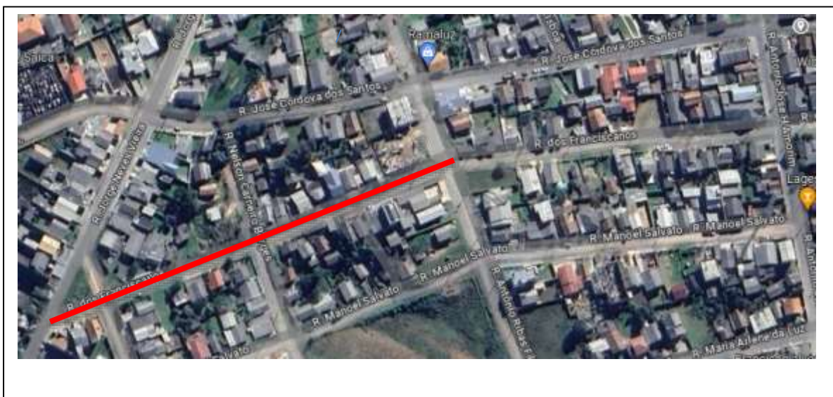
Figura 1- Localização da área de intervenção (trecho grifado)