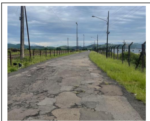
Figura 3- Foto Rua Projetada – Final do trecho