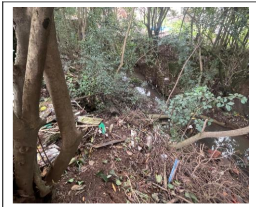
Figura 1- Foto Rua Projetada – córrego existente, onde será desaguado BSTC1.