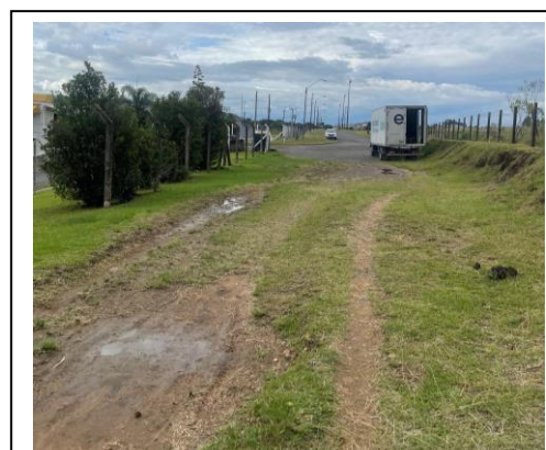
Figura 3- Foto Rua Projetada – local CP4.