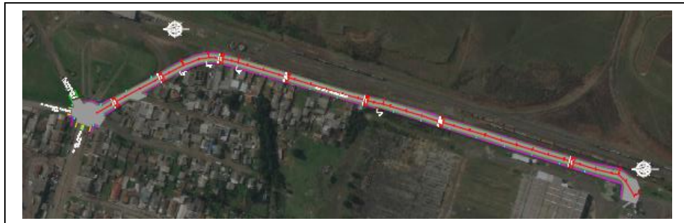
Figura 1- Localização da área de intervenção (trecho grifado)