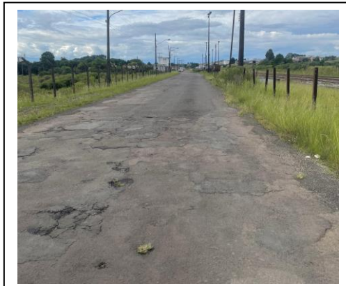
Figura 2- Foto Rua Projetada – Meio do trecho