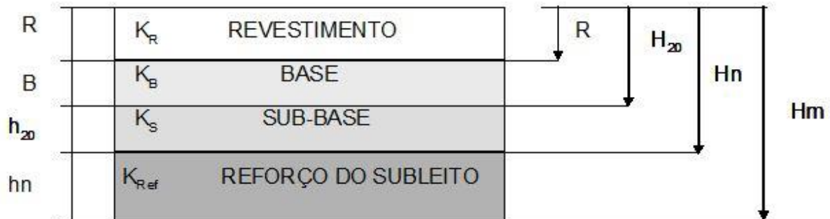
Tabela 6 – Caracterização pavimento

Fonte: Manual de Pavimentação DNIT, 2006.