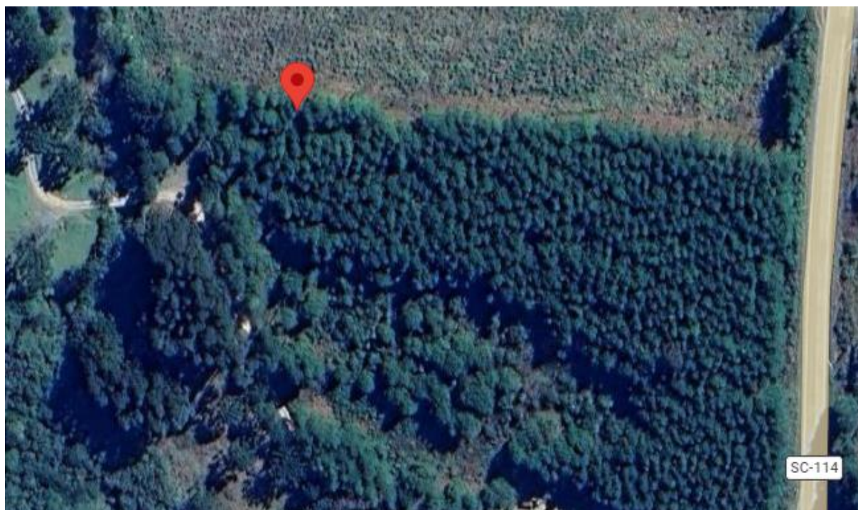
Foto 3: O Apoio 14 localizado na coordenada geográfica latitude -27.678913 e longitude -50.212002 na Estrada Geral do Tributo.