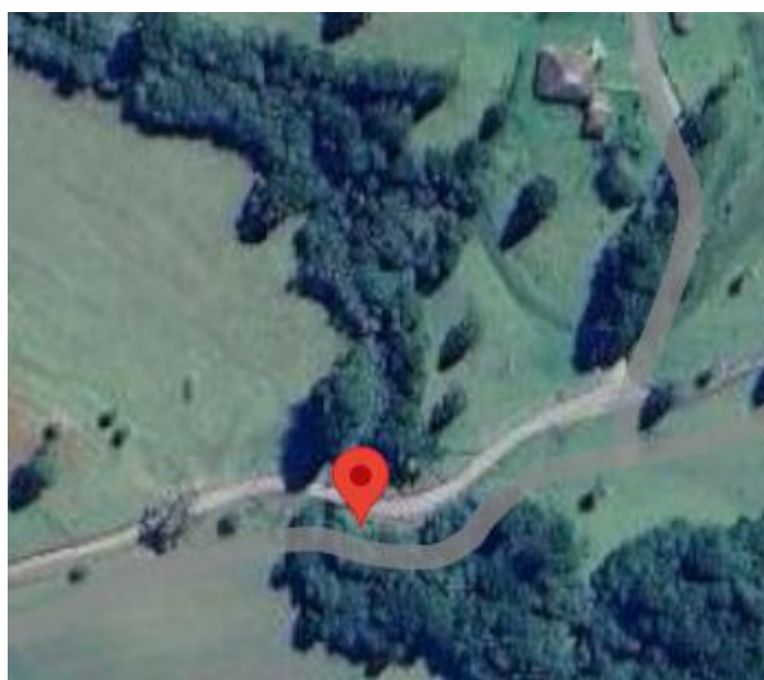
Foto 4: O Apoio 17 localizado na coordenada geográfica latitude -27.722387 e longitude -50.177907 na Estrada Geral de Gramados.