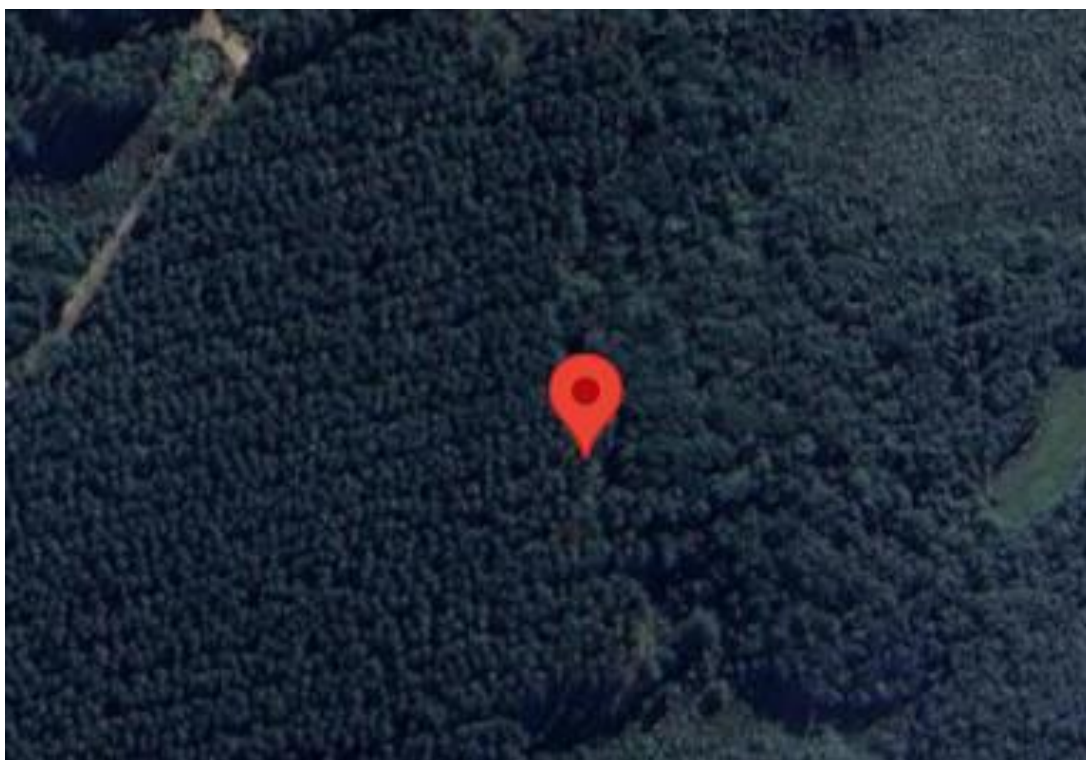
Foto 5: O Apoio 18 localizado na coordenada geográfica coordenada latitude -27.752305 e longitude -50.139687 na Estrada Geral de Macacos.

Os materiais, serviços e equipamentos fornecidos deverão atender aos padrões estabelecidos nas especificações técnicas pertinentes. Na ausência de especificação específica, prevalecerão as normas da Associação Brasileira de Normas Técnicas (ABNT) ou outras normas técnicas amplamente adotadas e consagradas na área a que se refere o bem e/ou serviço. Ressalta-se que deverão ser observadas sempre as versões mais atualizadas das normas técnicas emitidas pelas instituições competentes.