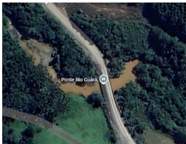
Foto 2: O Apoio 1 localizado na coordenada geográfica latitude -27.881785 e longitude -50.292492 na Estrada Geral de Morrinhos.

A execução dos serviços deverá obedecer às normas técnicas e aos métodos construtivos estabelecidos pela Associação Brasileira de Normas Técnicas (ABNT), bem como às demais legislações e boas práticas aplicáveis à engenharia civil.