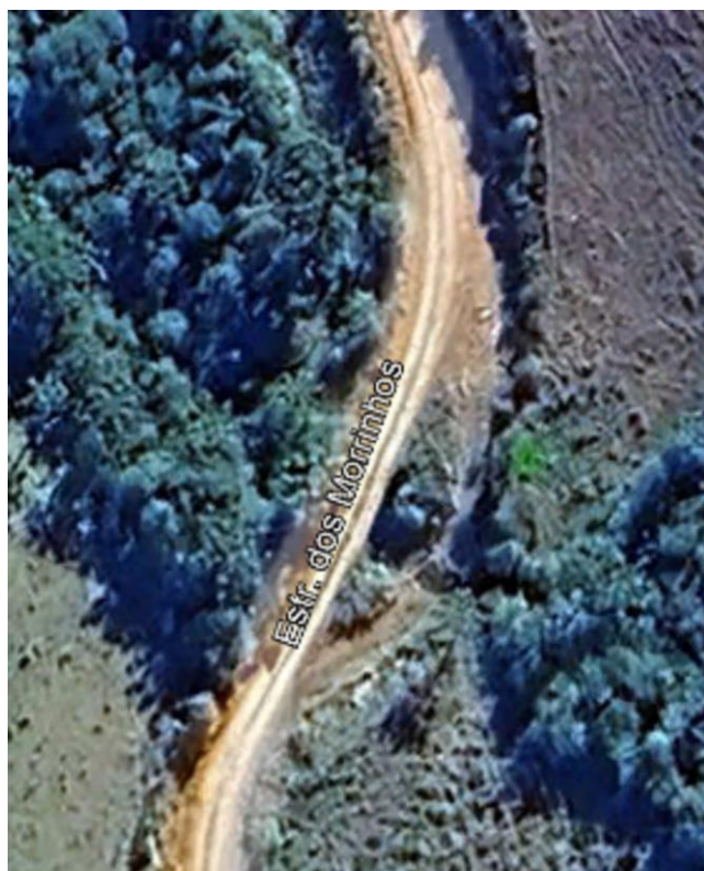
Foto 5: O Apoio 7 localizado na coordenada geográfica latitude -28.100397 e longitude -50.263913 na Estrada Geral de Morrinhos.

Os materiais, serviços e equipamentos fornecidos deverão atender aos padrões estabelecidos nas especificações técnicas pertinentes. Na ausência de especificação específica, prevalecerão as normas da Associação Brasileira de Normas Técnicas (ABNT) ou outras normas técnicas amplamente adotadas e consagradas na área a que se refere o bem e/ou serviço. Ressalta-se que deverão ser observadas sempre as versões mais atualizadas das normas técnicas emitidas pelas instituições competentes.