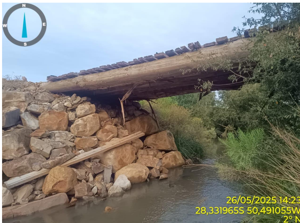
Foto 6: Exemplo de enrocamento a ser adotado, mostrando a disposição das pedras utilizada para estabilizar a margem e proteger os apoios da estrutura.