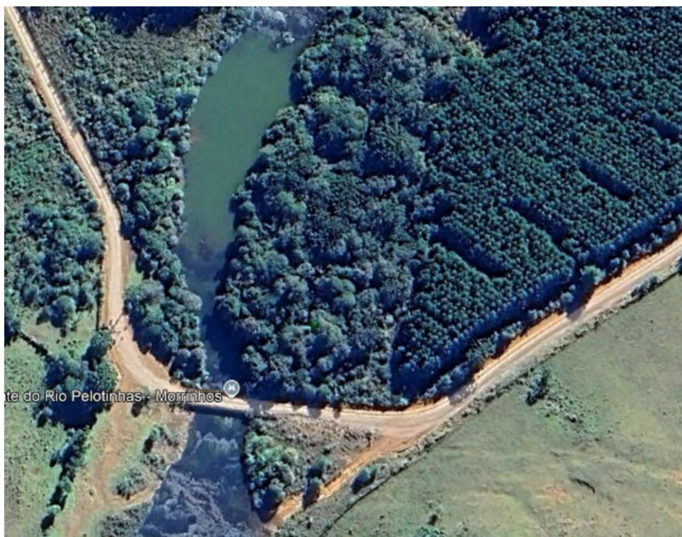
Foto 3: O Apoio 2 localizado na coordenada geográfica latitude -28.036930 e longitude -50.278243 na Estrada Geral de Morrinhos.