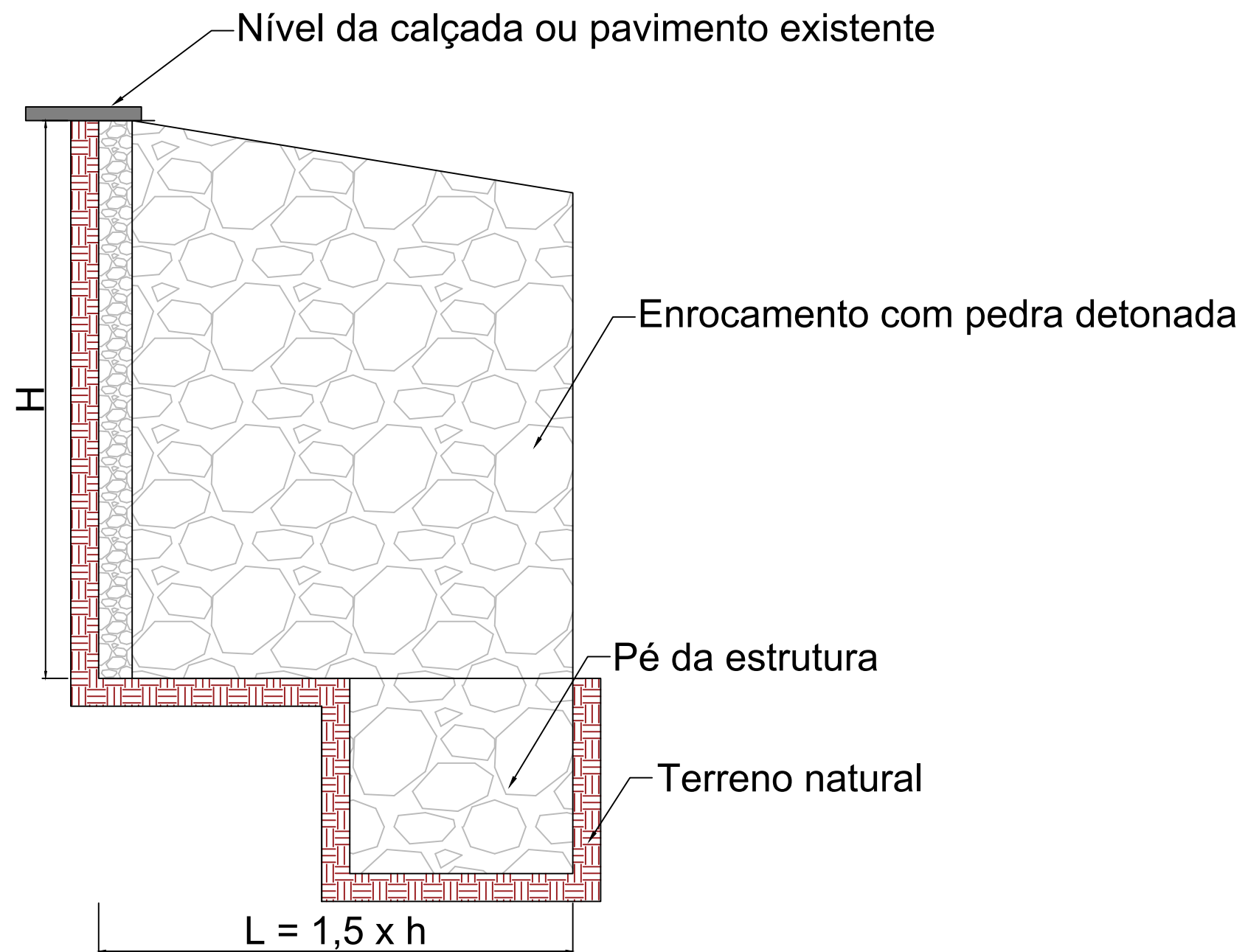
Detalhamento enrocamento com pedra detonada ESC.: 1:20